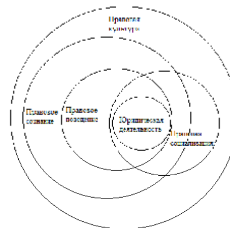
Система категорий социологии права

прежде всего необходимостью поиска основных механизмов включения социально-правовых явлений в систему общественных отношений. Ключевым аспектом теоретико-методологического осмысления этих феноменов является система понятий, отражающих сущность данных явлений. В качестве наиболее заметных категорий, отражающих особенности развития и функционирования права в социальном контексте, выступают правовая культура, правовое сознание, правовое поведение, правовая социализация и юридическая деятельность.